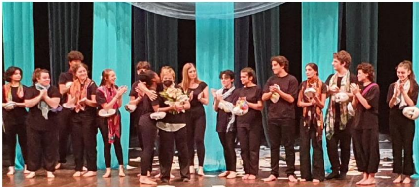
Lo spettacolo era stato presentato per la prima volta a maggio al Bonci

Quattro studenti cesenati oggi saranno sul palco assieme a 14 detenuti della casa circondariale