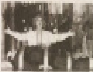
1972 | 1973

Il teatro del Pratello, con il Lago Isola, è in scena con Personi culturali fra la natura. L'opera è in scena dal 10 al 12 settembre.